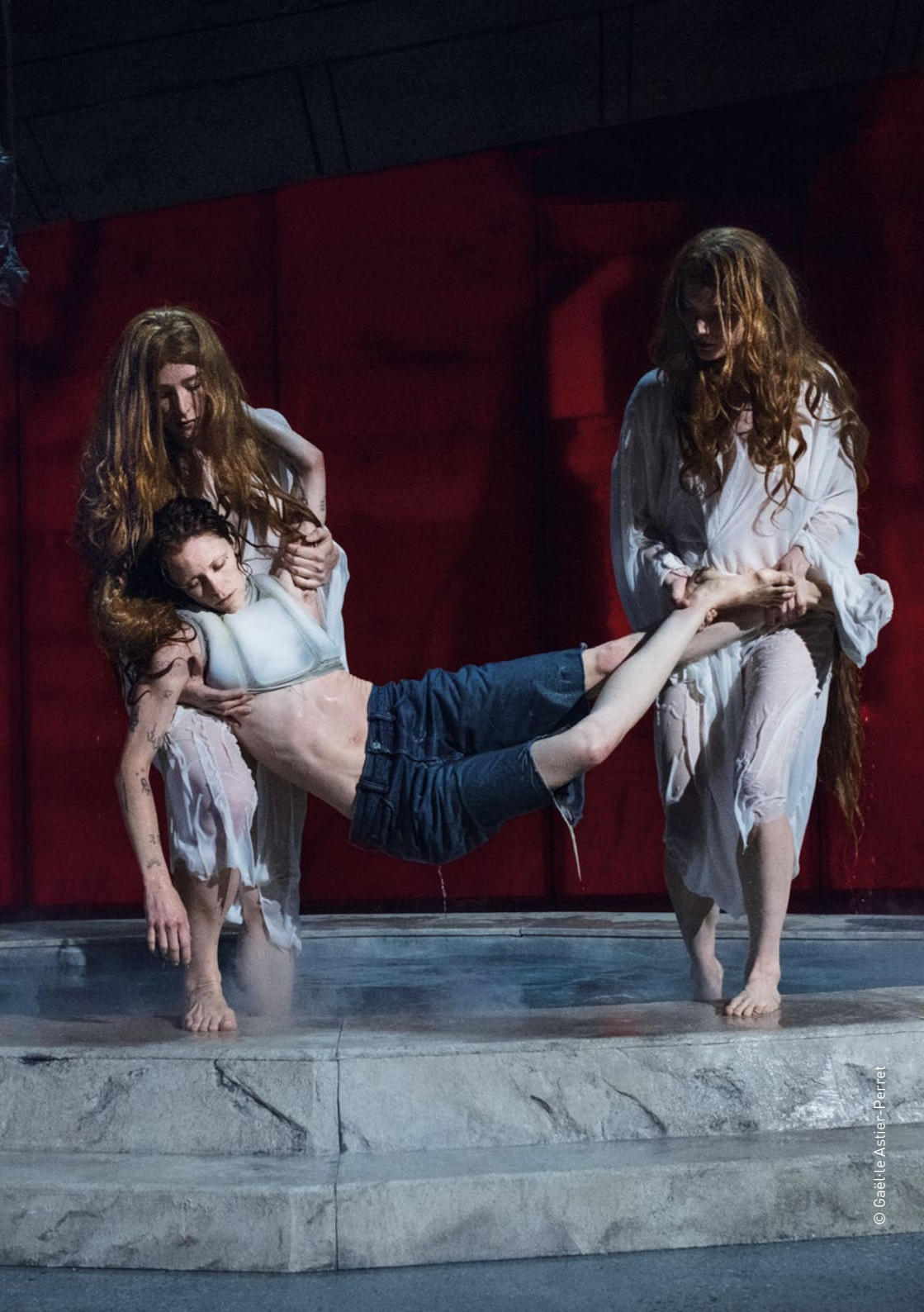
© Gaël Le Astier - Perret