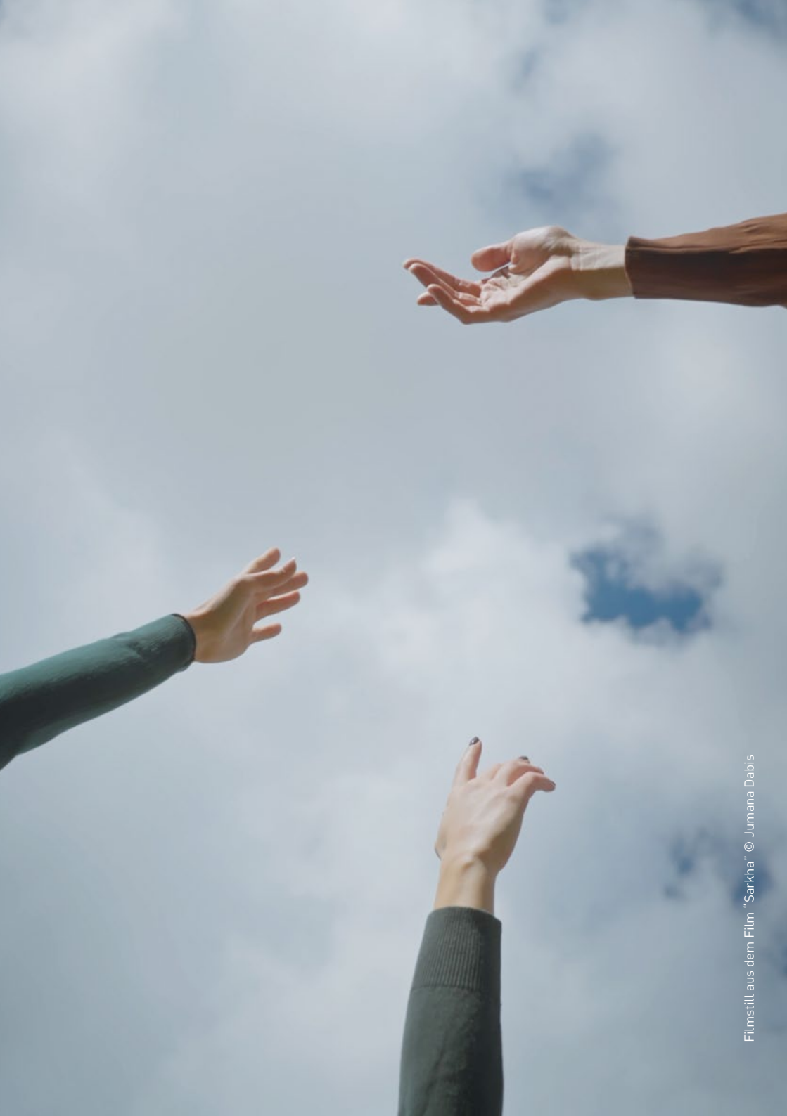
Filmstill aus dem Film "Sarkha"